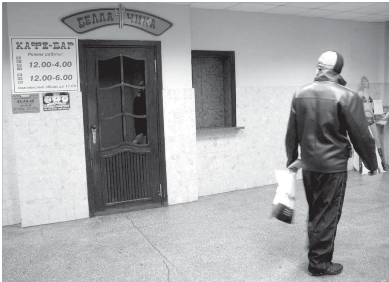
Удастся ли подросткам отметить выпускной во "взрослом" ресторане?