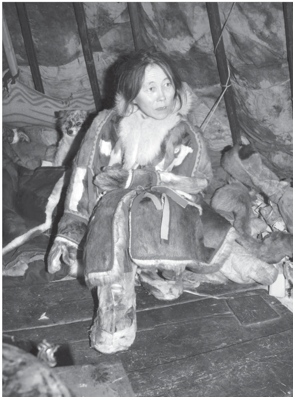
На Миле лежит все хозяйство семьи, кроме оленей

В семье Яптунэ было 10 детей. Но в живых осталось только семеро. В будущем году старший сын отметит 25-летие.