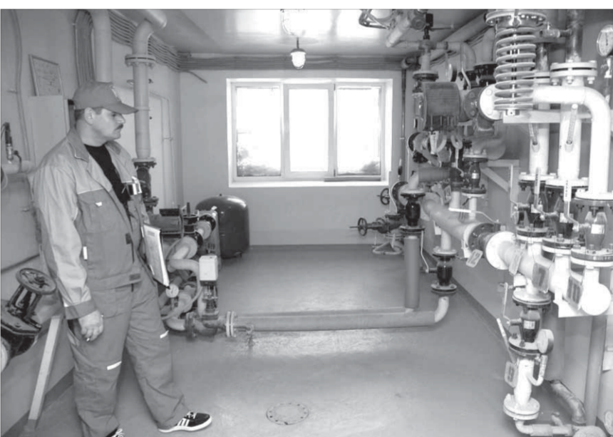
В обновленной гинекологии будет тепло

Отремонтированное гинекологическое отделение было обещано норильчанкам к Международному женскому дню еще три года назад. 28 марта 2008 года на Московской, 7, в очередной раз собралась рабочая комиссия по приемке объекта.