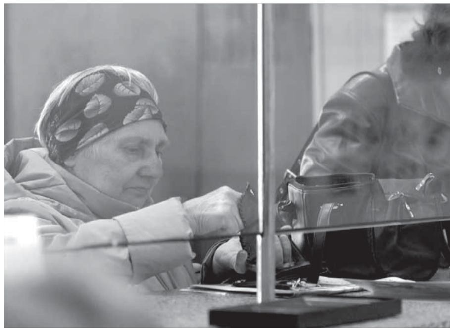
Сколько осталось в кошельке?

Бедному российскому карману дали возможность спокойно прожить полгода. В ближайшие дни правительство вернется к ценовому вопросу в масштабах всей страны. Для поддержки же регионов, первыми переживших мартовский "хлебный бунт", принимаются безотлагательные меры. Министр сельского хозяйства Алексей Гордеев в минувшую среду заявил, что из интервенционного фонда в Приморский край поступит 12 тысяч тонн зерна. Продадут его на 25 процентов дешевле рыночной цены.