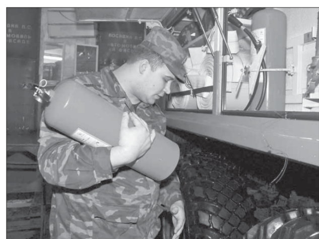
Пожарные оценили достоинства "Урала"

Пожарные Заполярного филиала компании "Норильский никель" получили девять новых спецавтомобилей "Урал". Это самое большое обновление автопарка за все годы работы пожарных частей на производстве.