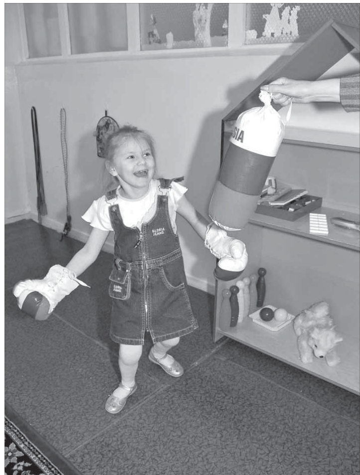
Скучным уроком бой!