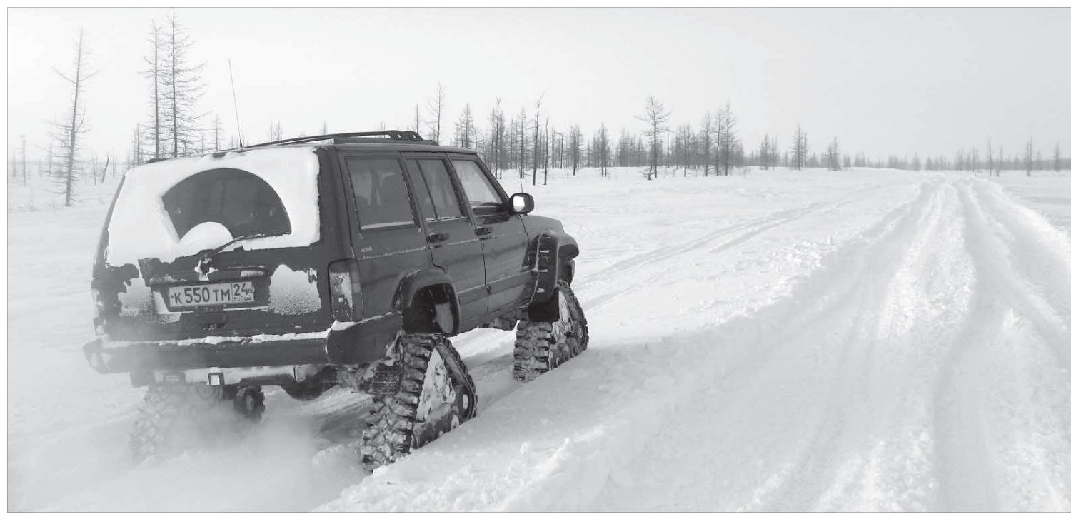
Члены клуба «Внедорожник-off» готовы стать первопроходцами

Мне бы хотелось, чтобы на мастер-классе пришли молодые креативные люди с новыми идеями.