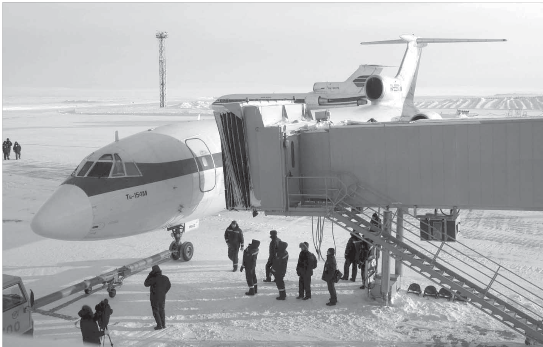
Авиакомпании борются за телетрап