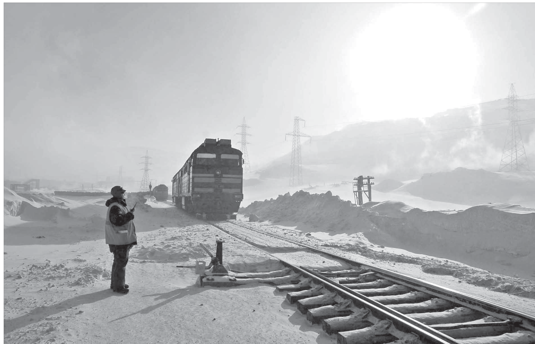
Нулевой пикет. Идет состав с рудой для НОФ

До настоящего времени таймырские спортсмены много лет занимались исключительно по программе акробатики. В этом виде спорта Таймыр вырастил не одно поколение успешных спортсменов, что позволяет с полным правом говорить о собственной школе. Финансирование занятий новым видом спорта взял на себя городской бюджет.