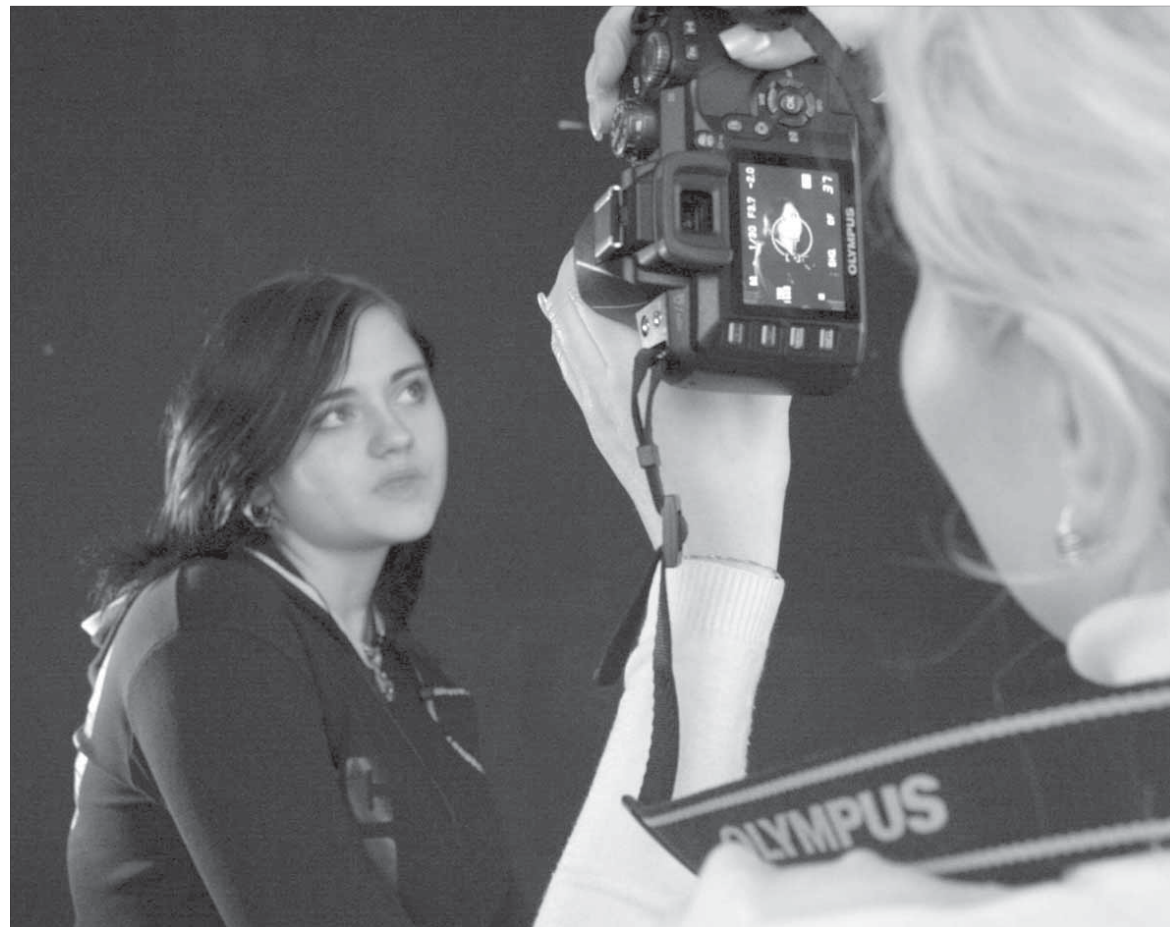
На курсах фотографии еще и фотомодели