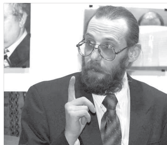
Плохих снимков не существует, считает Полторыхин