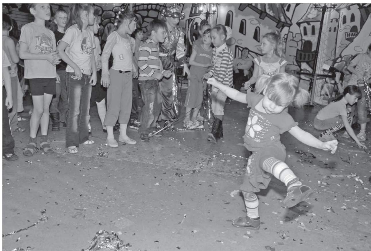
В веселье могли участвовать даже самые маленькие