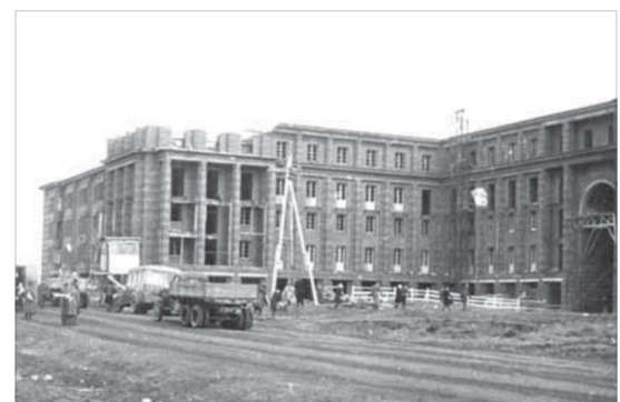
Каким быть Норильску, Сталин определял лично...

Своя "сталинская достопримечательность" есть и на промышленной площадке. Это мед-