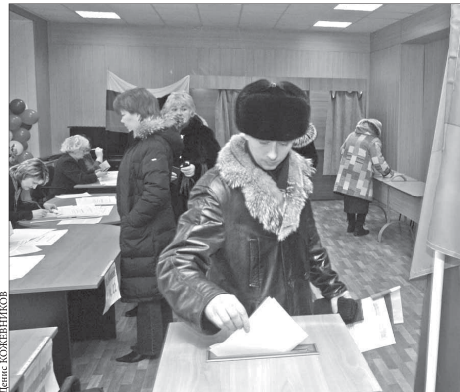
Норильчане, несмотря на погоду, проявили необычайную активность

В понедельник вечером итоговый протокол голосования на территории был подписан.