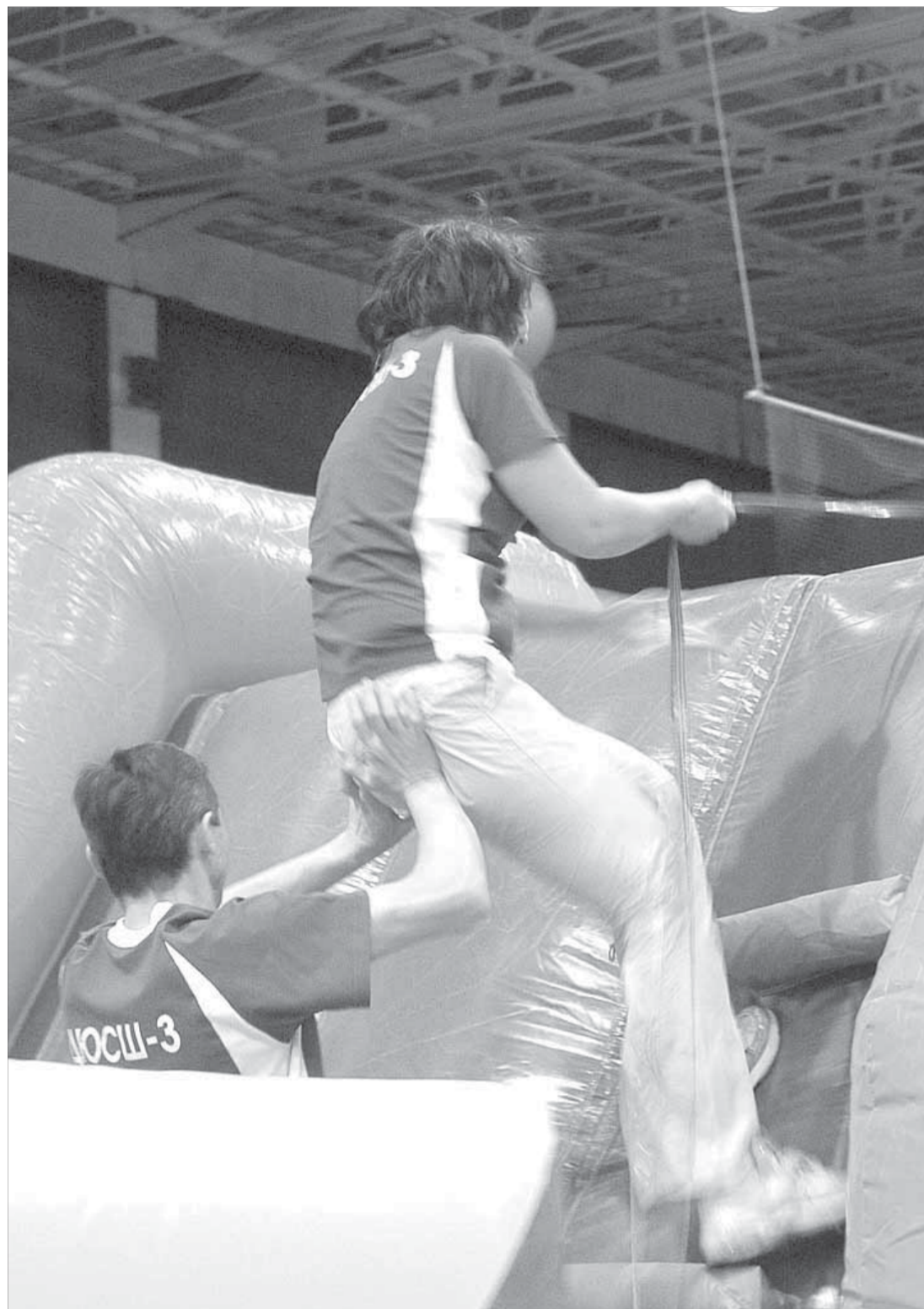
Не Эверест. Но тоже круто!