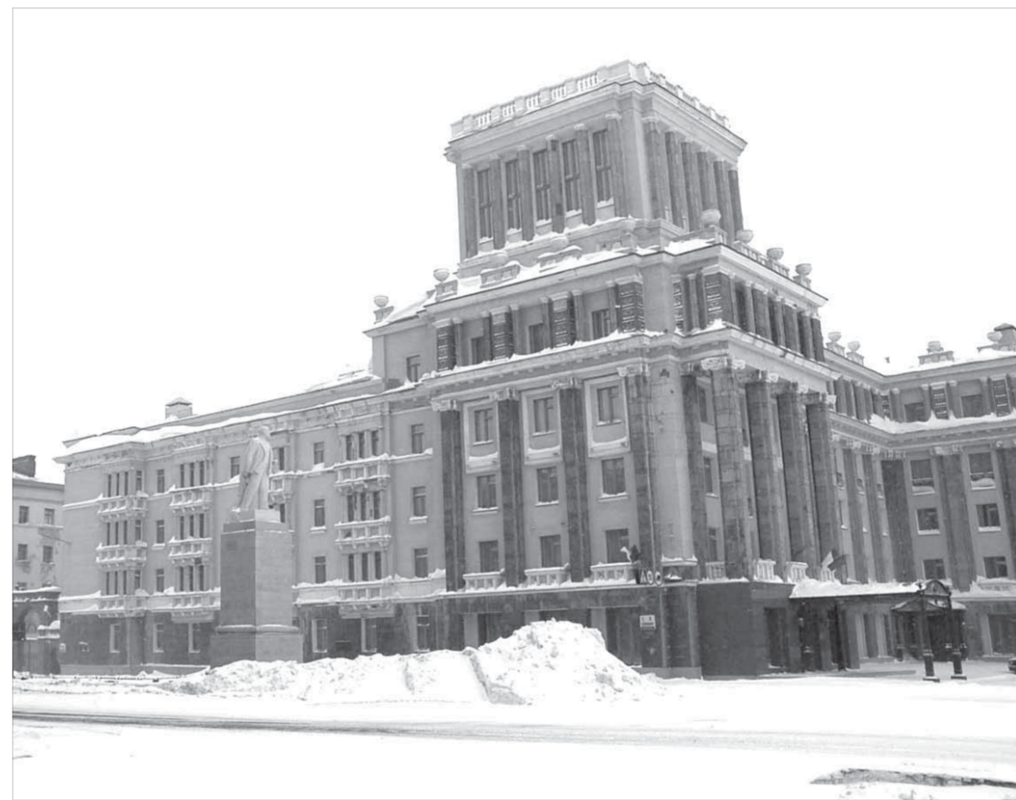
...сегодня он выглядит так