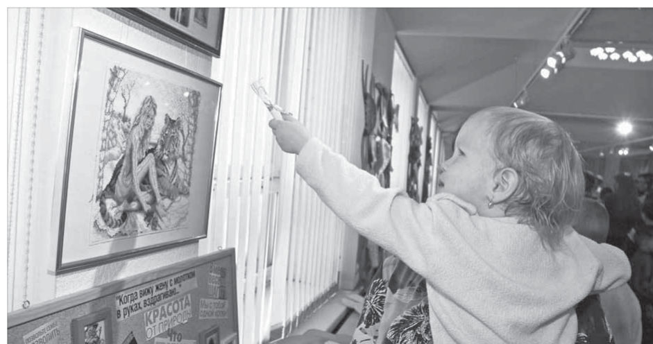
Многодетные семьи богаты талантами

Самодеятельные артисты доказали, что это именно так. Выступления юных певцов и танцоров дополнила агитбригада лихих супербабушек – хранительниц домашнего очага и, как всегда, завораживающие танцы профессионалов – коллектива “Оганер”.