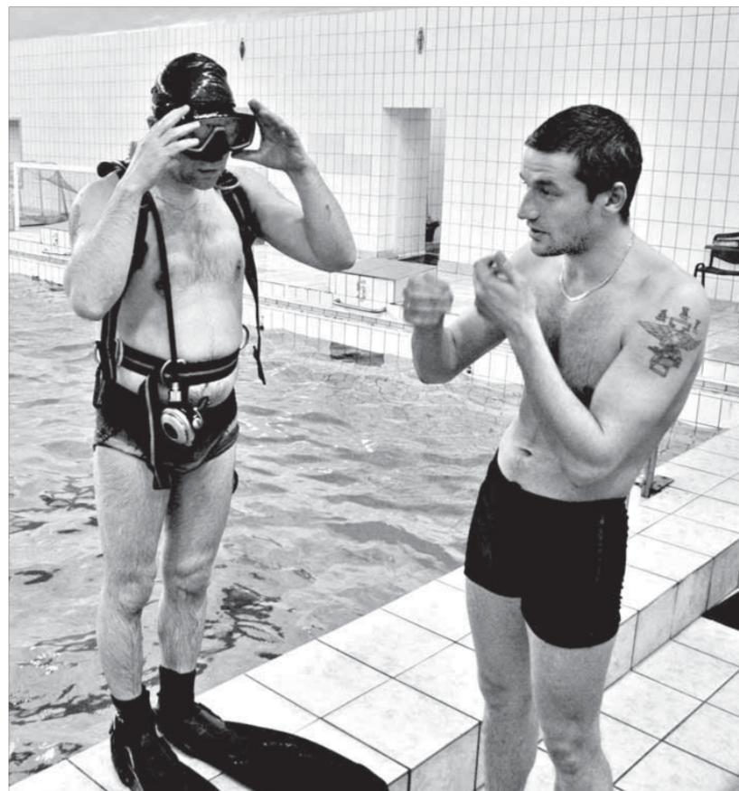
Бассейн – лучшее место для оттачивания мастерства