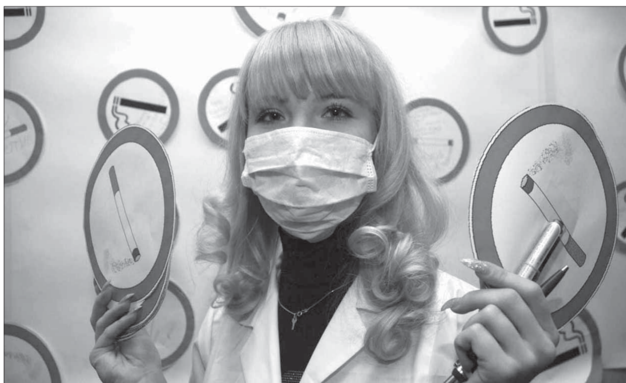
Бросил курить – напиши как