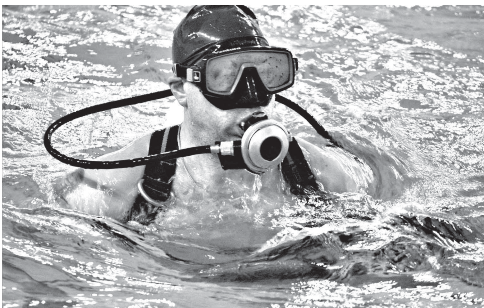
Русалок не нашел

Но русалки точно знают, что водолазам они – не пара. Потому по-прежнему лютуют слезы в свои подушки, а водолазы по-прежнему лезут в воду к своим заглушкам, задвижкам, дюкерам и трубопроводам. Ныряют даже по воскресеньям в ослепительно-голубую воду бассейна "Арктика" – чтобы организм был натренирован всегда. Чтобы не встали ТЭЦ-1, ТЭЦ-2 и ТЭЦ-3 и все производство, где задействована вода. Чтобы она бежала из кранов у нас дома.