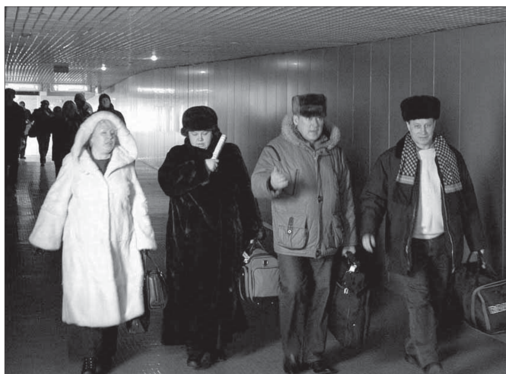
Первые пассажиры, ступившие в новую галерею