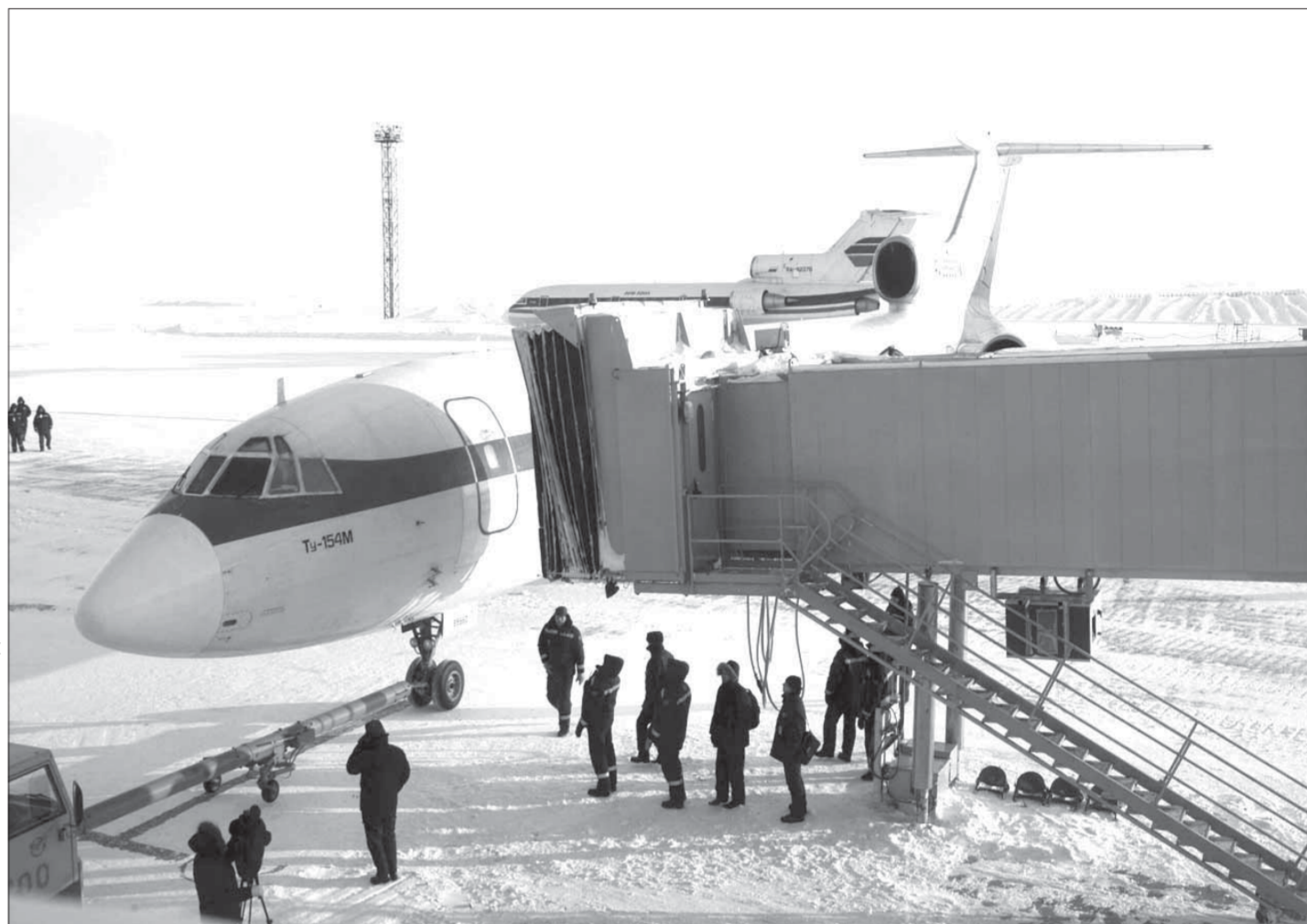
ТУ "швартуется" в Норильске

Вчера в аэропорту Норильск состоялось торжественное открытие пассажирского терминала. Это событие назвали вторым рождением аэропорта.