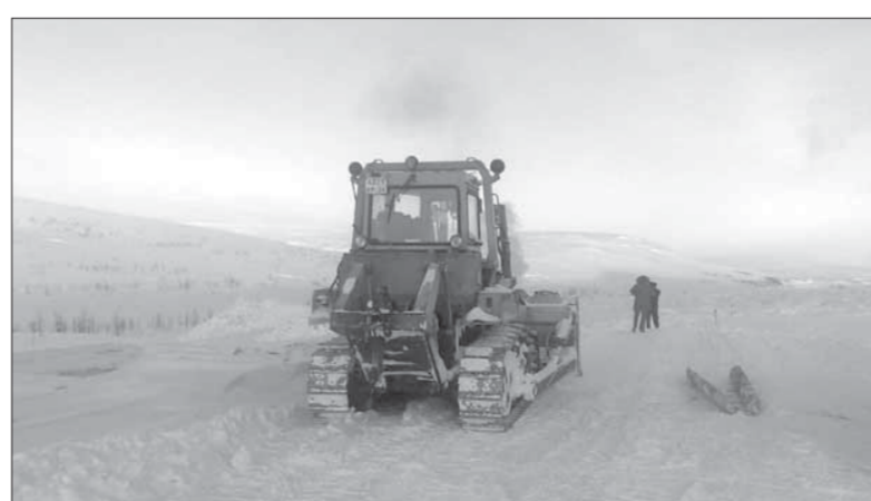
Пока на месте будущего вентиляционного ствола голая тундра

Thyssen Schachtbau является лидером в мировом шахтостроении, в своей работе использует новейшее оборудование и технологии и имеет высококвалифицированных менеджеров. Фирма предложила нам современные технологии, оптимальные сроки и разумную стоимость проекта. На основании всех этих факторов она и стала победителем, – говорит