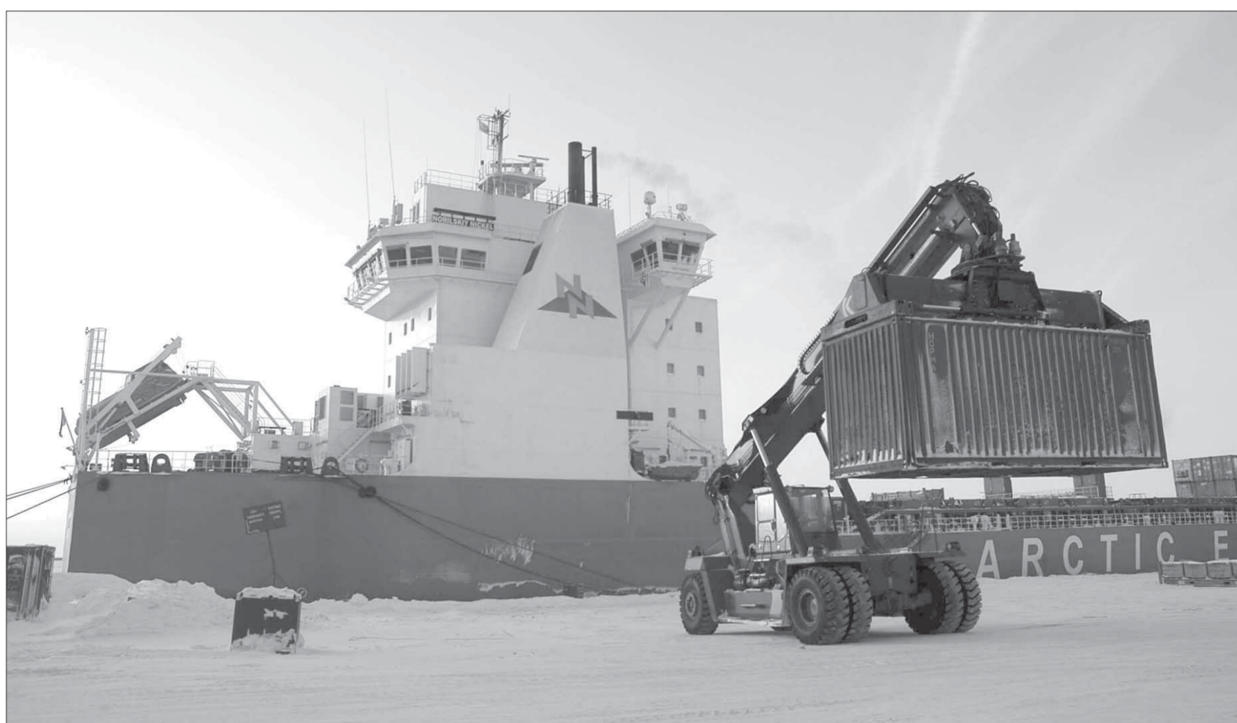
Дизельэлектроход возвышается громадой над причалом

И так из года в год вот уже 70 лет бурлит жизнь в морпорту Дудинка. Круглосуточно, без выходных и праздников. Хотя есть один. С 17.00 31 декабря до 08.00 2 января каждого года порт замирает. Он, как и все его работники, тоже празднует наступление Нового года.