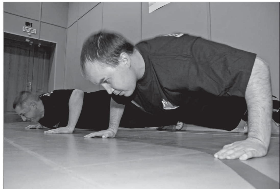
После долгого сидения в кабинетах отжимания – почти экстрим

– По сумме баллов за все дни соревнований, – объясняет он, – выявим победителей. У нас уже и призы подготовлены – сертификаты на приобретение спортивной одежды в магазине «Стиль». Так что нашим работникам есть к чему стремиться.