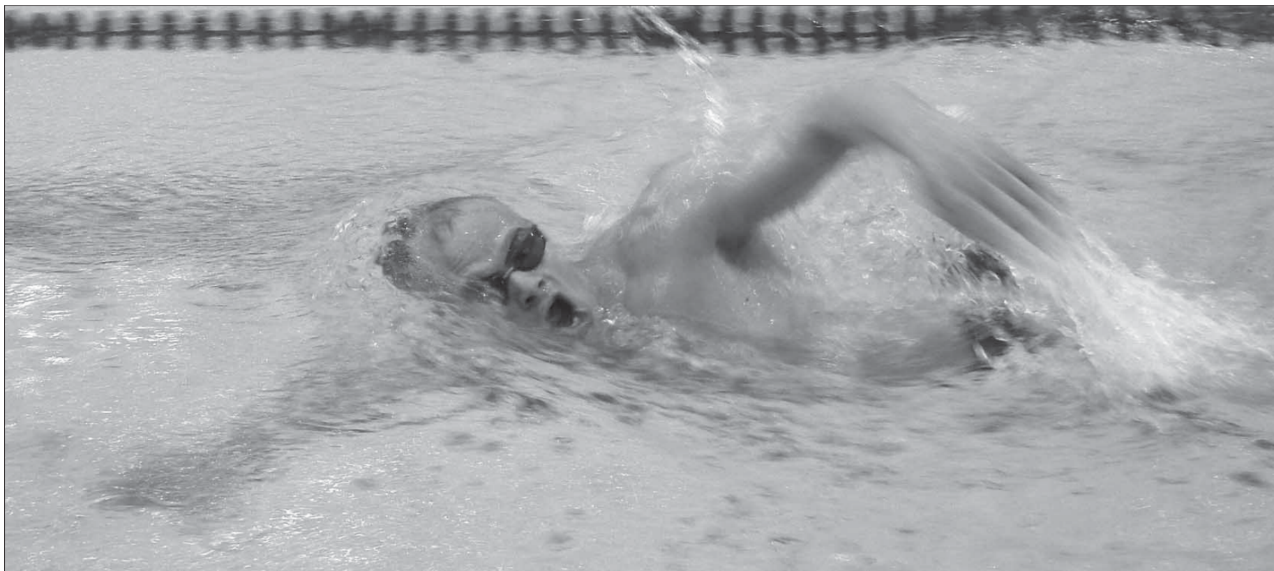
Игорь Барышников в бассейне как рыба в воде