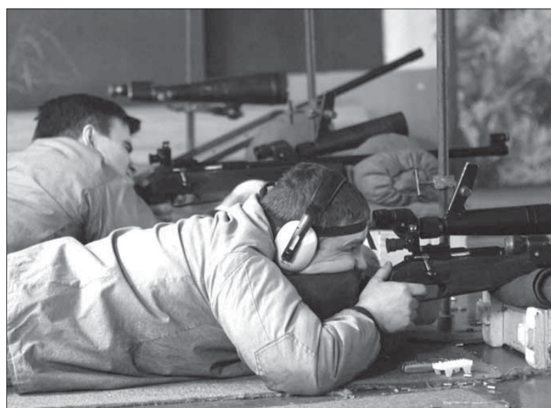
При стрельбе главное – спокойствие

Более чем на неделю растянулись соревнования по стрельбе в рамках 47-й спартакиады. По словам организаторов и судей, неблагоприятная погода не позволила вовремя занять огневой рубеж стрелкам с предприятий Талнаха, Кайеркана и Дудинки. Но турнир состоялся.