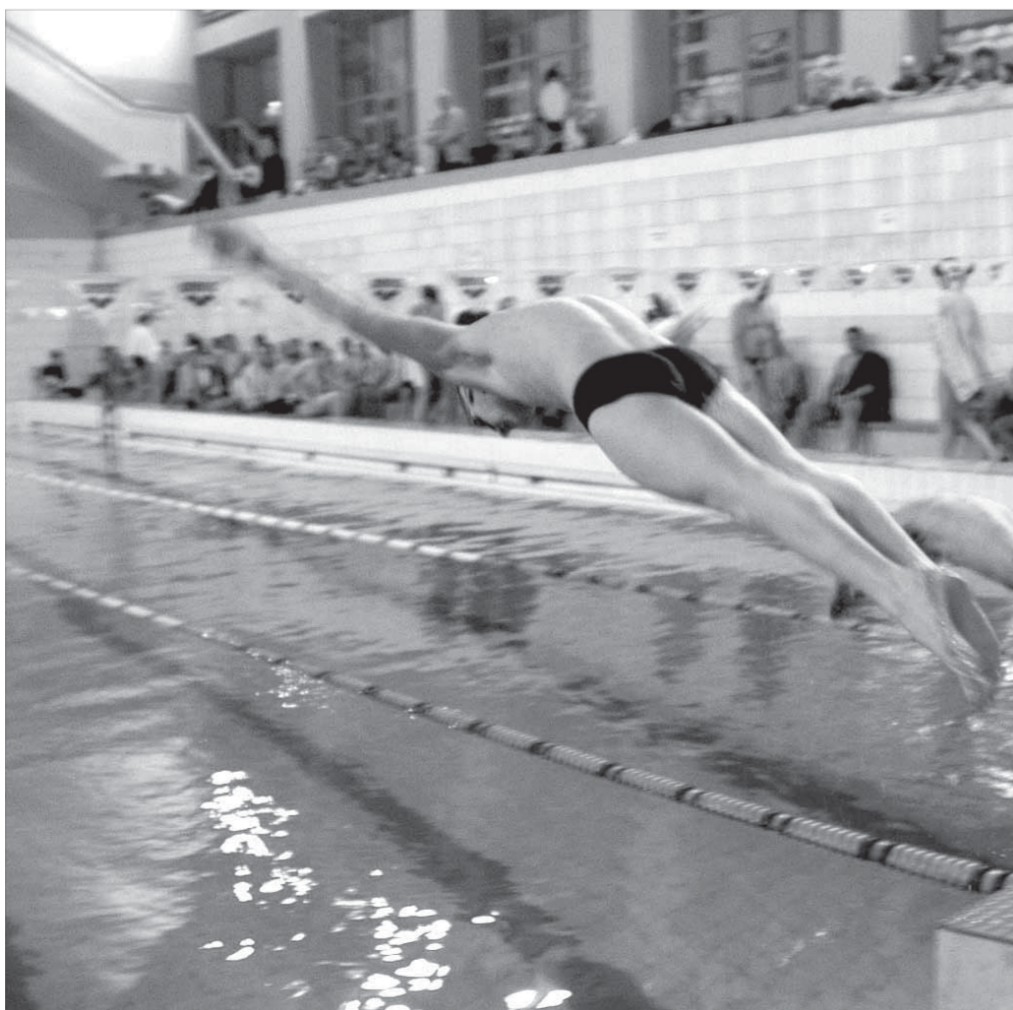
Пловцы достойно завершили соревнования

Среди ветеранов в первой группе "надеждинцы" переплывали спортсменом медного, а во второй – НПТ обыграл в общем зачете Заполярный транспортный филиал.