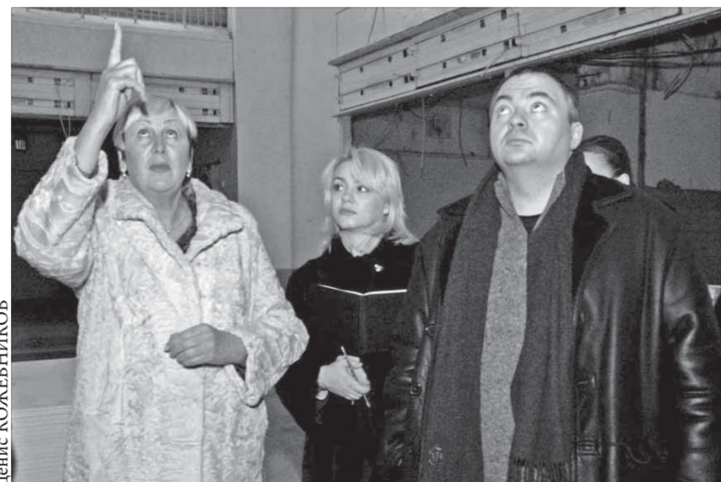
Надежна наша крыша!