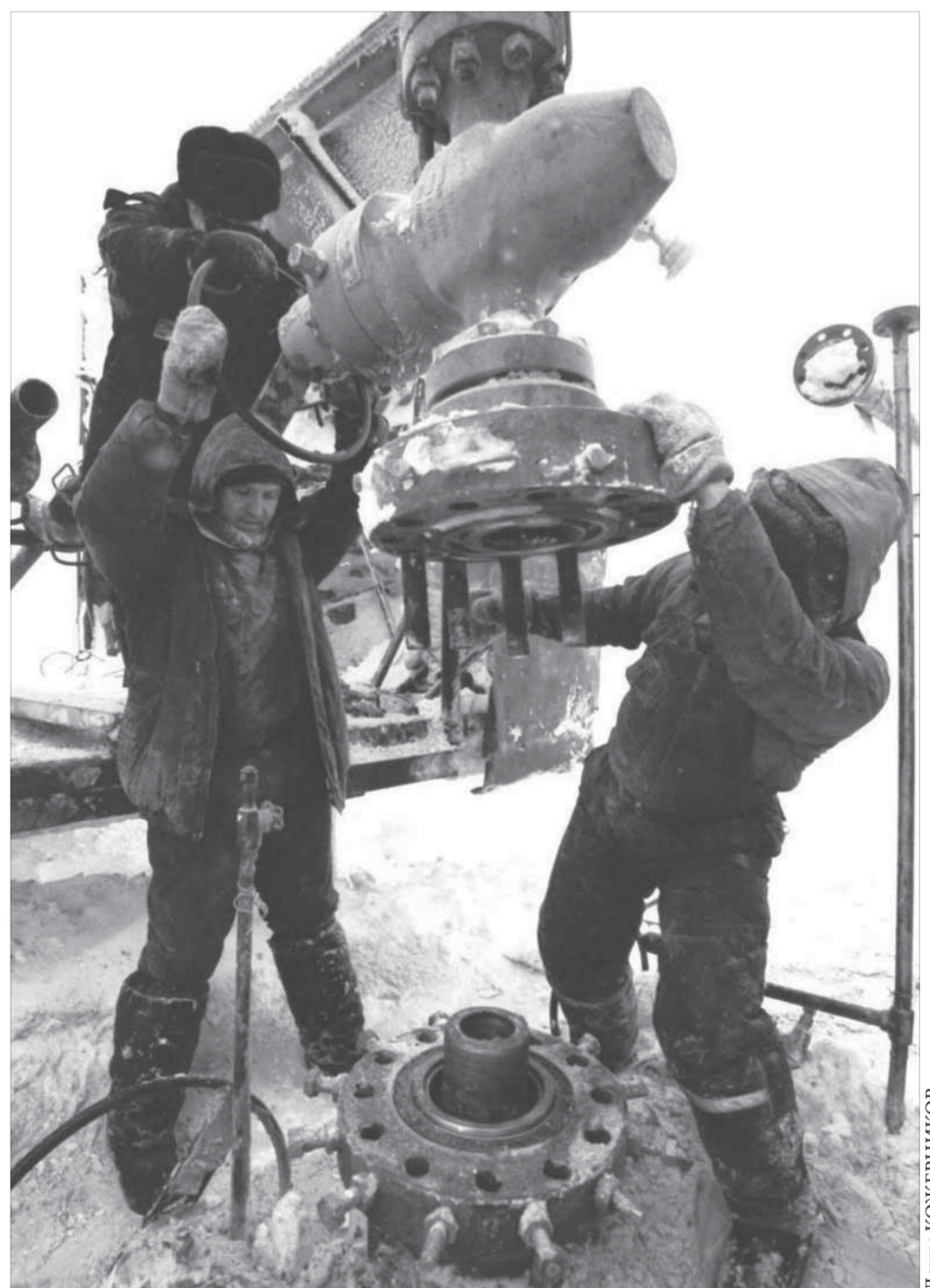
Работа геолога трудна, но в то же время и романтична

– Сегодня геология получила более прагматическую направленность, потому что собственник должен иметь понимание, что это ему принесет. Другое дело, что государство должно изучать территорию своей страны и привлекать инвесторов. Начальную стадию поисков – создание геологических карт, проведение комплексных опережающих поисковых работ – должно, на мой взгляд, финансировать государство. Таймырский полуостров, пожалуй, наименее изученная часть России, поэтому потенциал Таймыра не раскрыт, и хотелось бы, чтобы государство более активно изучало свою территорию.