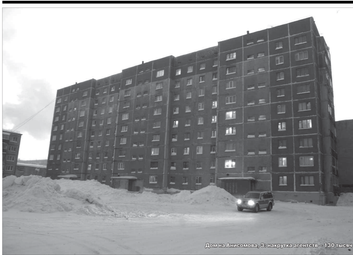
Дом на Анисимова, 3: нагрузка агентств – 130 тысяч

Семь партий, набравших менее трех процентов голосов, должны будут вернуть СМИ средства, потраченные на собственную агитацию и пропаганду. Расходы каждого члена этой семерки колеблются в пределах от 140 миллионов до 170 миллионов рублей.