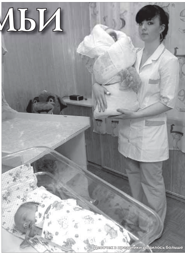
Девочек в правдники родилось больше