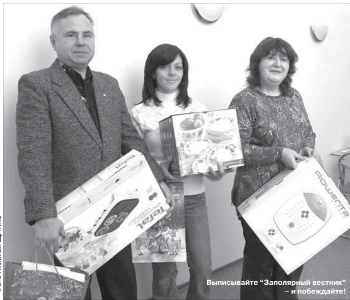
Выписывайте “Заполярный вестник” – и побеждайте!

Более 10 тысяч подписчиков будут читать “Заполярный вестник” в первом полугодии 2008 года. Кроме того, газета распространяется еще по 20 точкам Большого Норильска и за его пределами, так как доставляется на борт самолета авиакомпании “КрасЭйр” и “Сибавиатранс”.