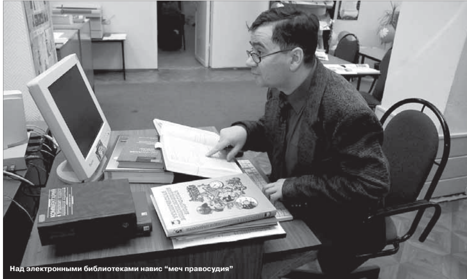
Над электронными библиотеками навис "меч правосудия"

В первый день нового года начался третий этап "глобального увеличения" штрафов. Самыми серьезными нарушениями